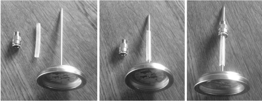
Pneumatische insteek, luchtslang & braad thermometer

Voor het plaatsen van een braad thermometer in een pan kan gebruik gemaakt worden van een pneumatische insteek. Slangen zijn in de maten 6, 8, 10 millimeter.