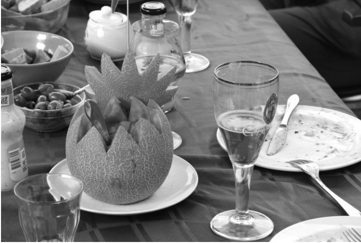
Fruit en bier: vitamine C en vitamine B

maart 2014 (te vinden op onze website), maar ondertussen uitgebreid met de nodige elektronica. Een kerntaak is in de schakelkast weggelegd voor een Arduino minicomputer, die e.e.a. aanstuurt. Overigens zit onderaan in de schakelkast een vijftal switches waarmee ook alles nog handmatig kan worden geregeld.