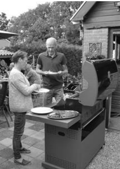
Timo en Marijke bespreken het gebodene op de “Jamie Oliver”