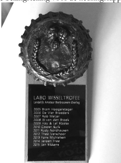
Hij staat weer in Friesland, de Wisseltrofee!!