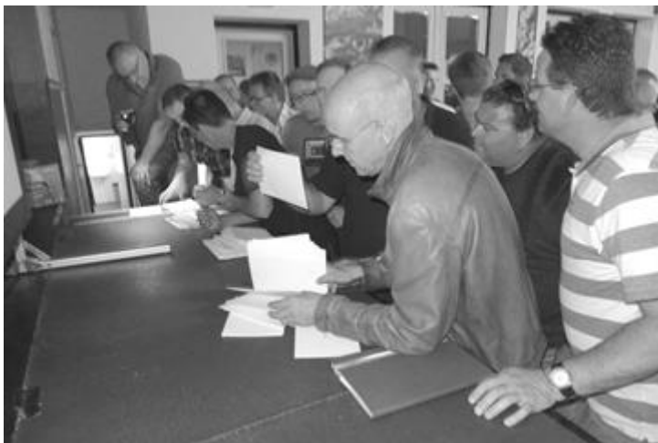
Grote belangstelling voor de keuringsrapporten.