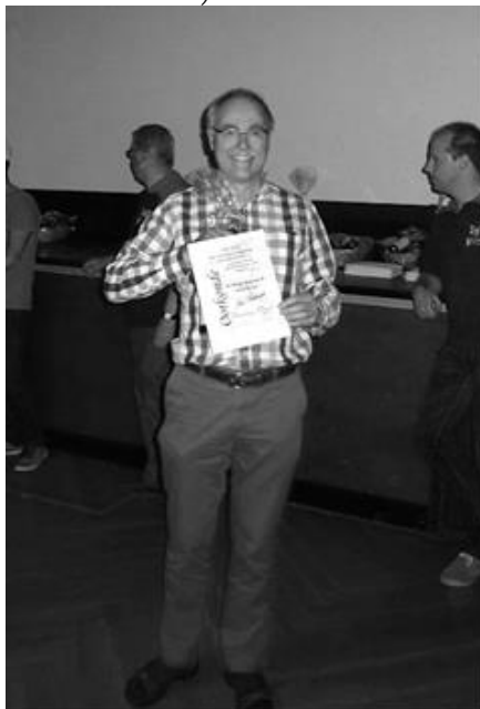
Jos: een 2 e Prijs